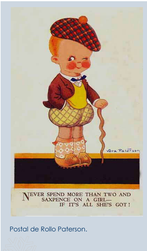
Postal de Rollo Paterson.

fundó el Banco de Inglaterra en 1694 y, más adelante, promovió el ardid desastroso de Darien en Panamá que se derrumbó en 1700. William Paterson nació en Tinwald, Dumfries y Galloway, Escocia y vivió con sus padres hasta los diecisiete años, cuando emigró primero (brevemente) a Bristol y luego a las Bahamas. Fue aquí donde por primera vez concibió el Plan Darién, el plan era crear una colonia en el istmo de Panamá, para facilitar el comercio con el Lejano Oriente. Paterson regresó a Europa e invirtió su fortuna en los bancos Holandeses, y trató de convencer al gobierno Inglés de James II para llevar a cabo el Plan de Darién. Cuando le negó el apoyo, intentó entonces persuadir a los gobiernos del Sacro Imperio Romano y la República de Holanda para establecer una colonia en Panamá, pero fracasó en ambos casos.