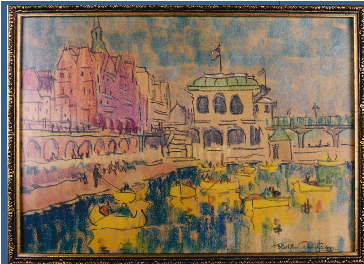
Pastel de Rollo Paterson. El estanque de barcas y la entrada al embarcadero con el edificio rojo del hotel Metropole de Brighton, England.